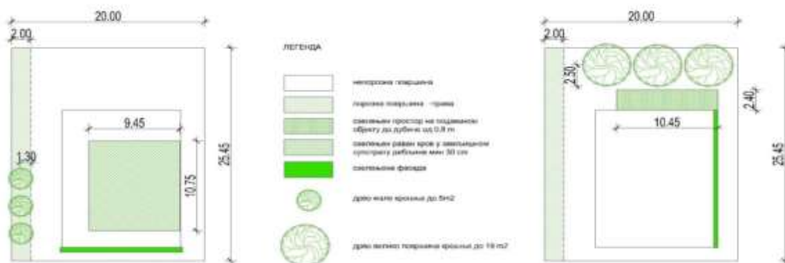
Слика број 1. Пример реализације предвиђеног еколошког индекса на парцели

У табели број 14. Су дати еколошки индекси.